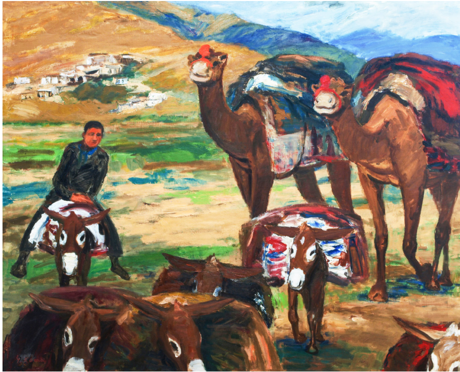
No.1 小間嘉幸《草原の旅》油絵、キャンバス