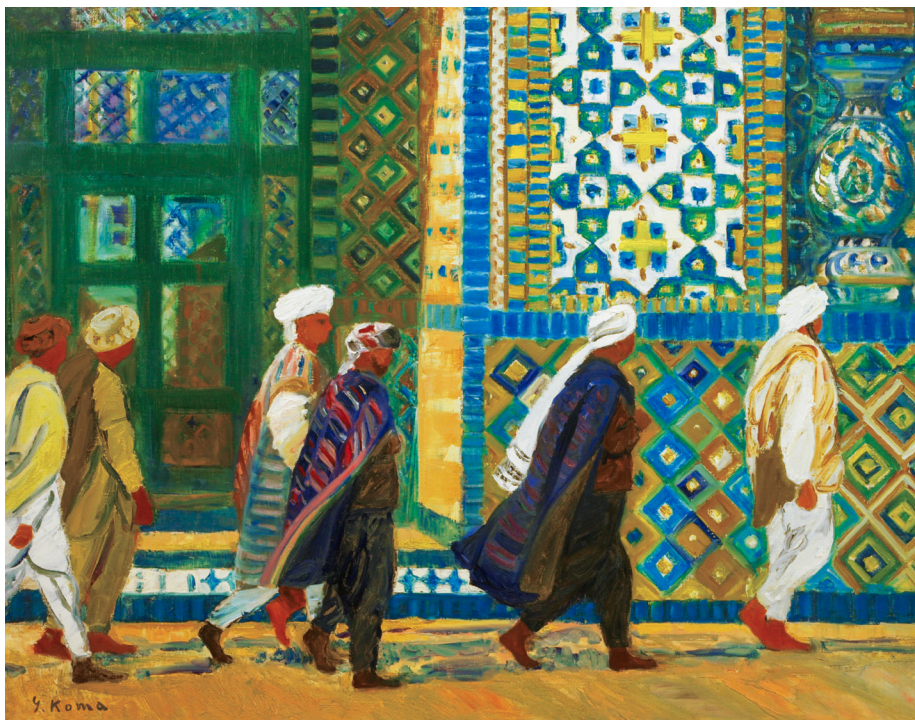
No.24 小間嘉幸《マザリシャリフの巡礼》油絵、キャンバス