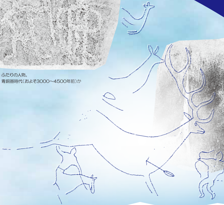
鹿、射手、騎馬の場面。 およそ1500年前。

シベリアの各地には、岩壁に動物や人物などの図像を刻んだ「岩壁画」が残されています。古代の人々がシベリアの大地に残した芸術作品です。1980年代に日本人考古学者がシベリアのアルタイで岩壁画の拓本を採取、その一部が2010年に当館に寄贈されました。この貴重な拓本約10点を特別公開します。