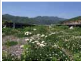
旧第一玄関 写真展