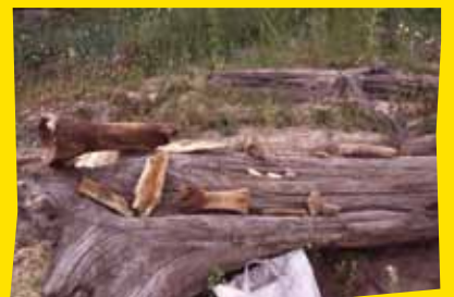
シベリアのエニセイ川流域で採集された動物骨。 一番大きなものはマンモスの骨。